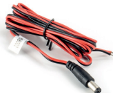
power cable (AK1001)