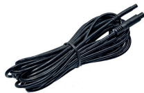
extension cable (AK1016)