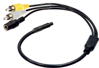
adapter cable (AK1014)